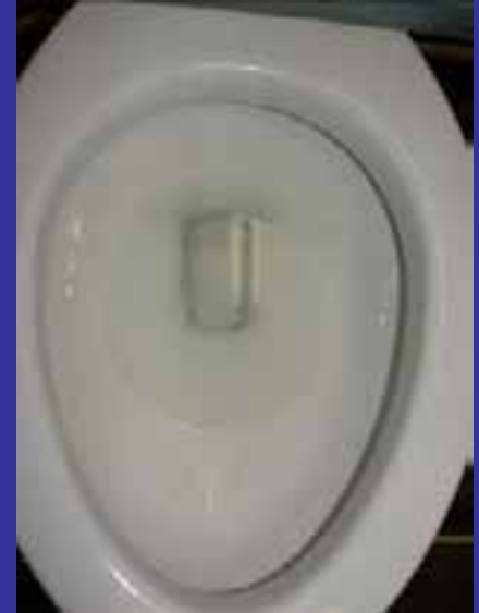
65 días de descarga