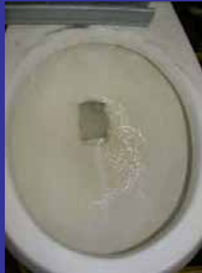
52 días de descarga